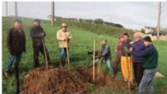
La plantation a eu lieu malgré un temps pluvieux.

Publié le 14/12/2019 à 06:26 | Mis à jour le 14/12/2019 à 06:26