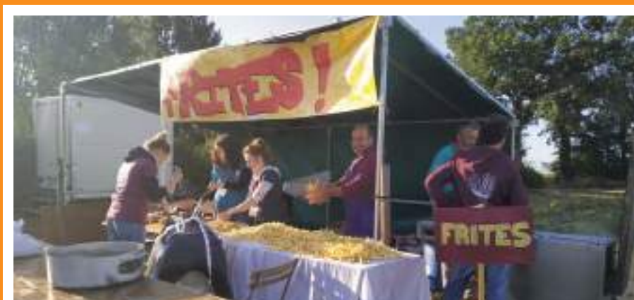
Le bénévolat lors de la Fête Bio :