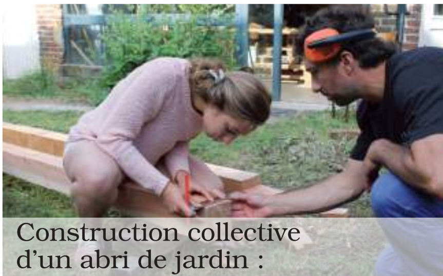
Construction collective d'un abri de jardin :