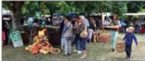
Dimanche 8 septembre, à Boursay. Plus de 3 000 visiteurs ont pris le chemin de haies, bordé de trognons, pour y découvrir la 28 e Fête bio, ses exposants, expositions et animations.

Entre ambiance décontractée et agitation foraine déjantée, les milliers de visiteurs ont profité des nombreuses animations proposées: traditionnel marché, ateliers, découvertes (poteries, premier contact terre, fabrication