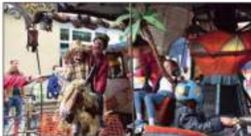
Parade de tric et de do-trois, le carnaval Tirois et ses artisans ont animé les petits, devant les parents hilares qui en redemandaient.

de bombes à graines...), livraisons lecture sous les arbres, expositions, initiation aux danses traditionnelles, traction animale et récolte participative de pommes de terre, pressage traditionnel de jus de pomme, rencontre avec les associations locales... Le clou du spectacle revient au manège-théâtre Timonoc, avec ses animateurs de folie qui invitent « enfants et humains » à entrer dans leur univers finistérien. Une ambiance foraine détraquée,