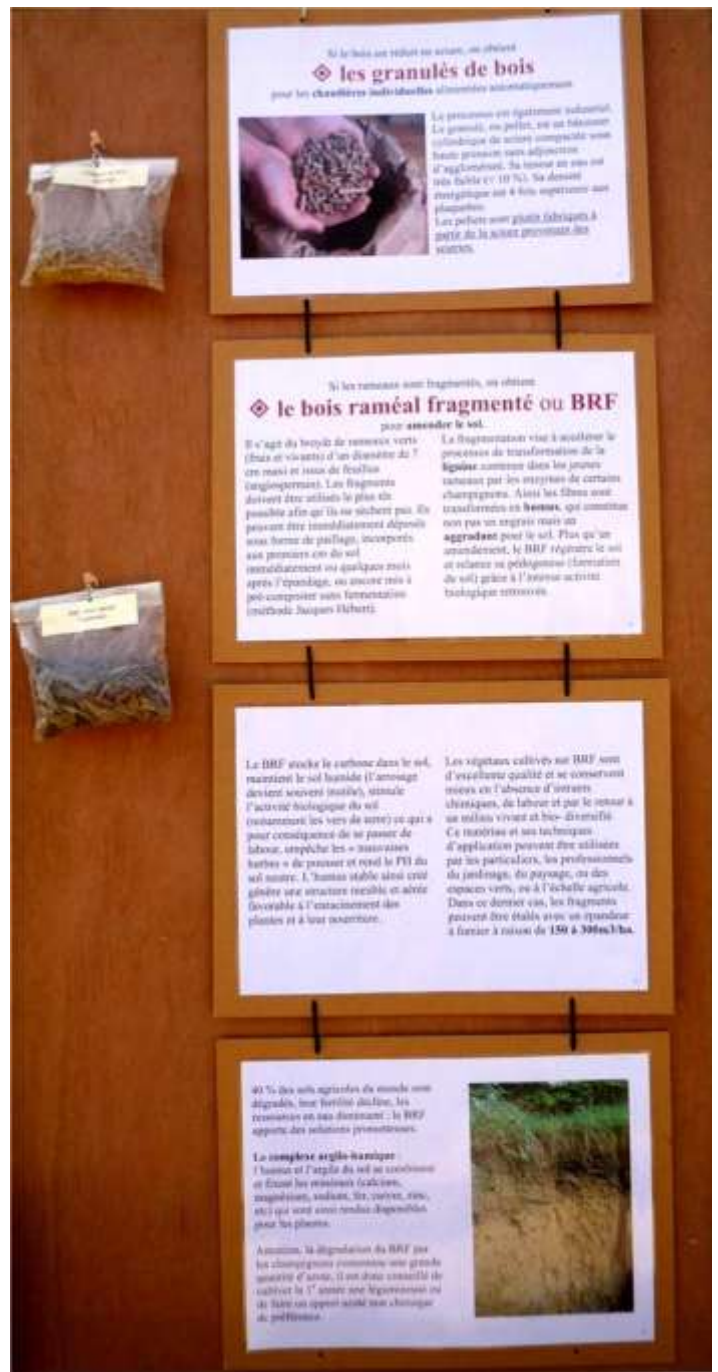
Les 2 premiers panneaux de l'exposition « Valorisation du bois de la haie »