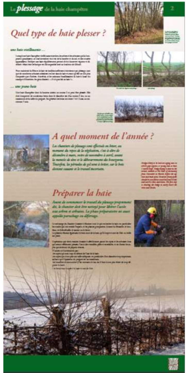
Les 2 premiers panneaux de l'exposition « Plessage de la haie champêtre »